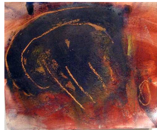
il terzo libro

tutte annotazioni: tecnica mista su carta, ca. 38x46 cm