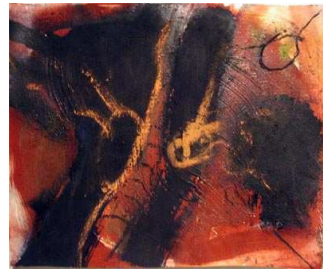
il secondo libro