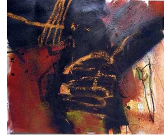
il primo libro